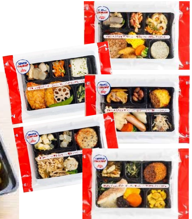
※写真はすべてイメージです