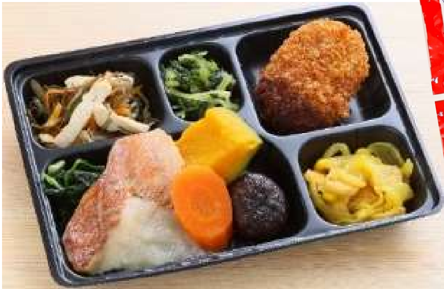
弁当容器サイズ：約 21×15.5×2.5 cm