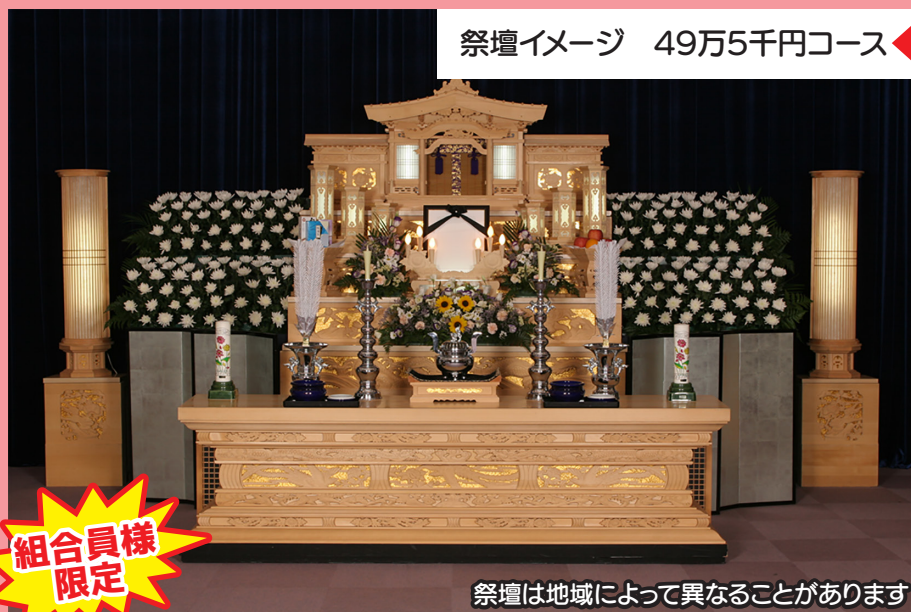
祭壇イメージ 49万5千円コース