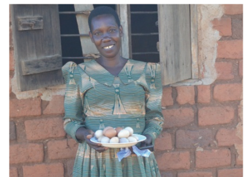
卵を手に、誇らしげな住民の女性

地域が HFW の支援を卒業した後も協同組合がこの事業を継続できるよう、HFW は 協同組合による自主運営をサポートしています。昨年は、協同組合がより効率的にヒ ナを購入できるよう、共同購入のしくみづくりをサポート。自信をつけた協同組合は 今年は生後間もないヒナを購入することを決定しました。生後すぐの飼育には温度管 理など特別なケアが必要なため、昨年までは生後1ヵ月以上が経過したヒナを購入し ていましたが、今年からは生後1ヵ月のケアも協同組合が行います。これにより、協 同組合の飼育能力の強化が期待できるほか、協同組合のヒナの購入費も1羽あたり 7000 シリング (251 円) から 2200 シリング (79 円) に削減されます。 協同組合が飼育したヒナはその生育期間に応じて、組合員が 7000 シリング (251 円) ～ 1 万 4000 シリング (502 円) で購入、その後の飼育を担います。以前は 遠方の業者からヒナを購入していた組合員も、地元の協同組合から購入することで 購入費の削減になっています。