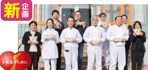
みやげ食品のと国分寺工場の従業員のみなさん

073 6月 4回 主原料別 CMC 管理済み 1個110g 39kcal 高糖1.0g 4個入り CO-OP 5種の具材入り冷し茶わんむし 主原料:鶏卵(国産) (賞)25日 卵 麦 和 みやげ食品