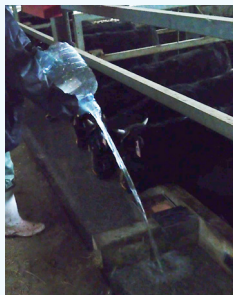
牛にあげる水は、停電の中人力で運びました。

「牛を自然豊かな土地でストレスなくのびのびと育てたい」そんな理念のもと、能登町で牧場を営んできましたが、今回の地震で被災してしまいました。震災直後は、電気が止まり、通話もできなくなり情報が一切入ってこなくなりました。スタッフは自宅が被害を受けたにもかかわらず、牛たちの世話をするために水を運び、自分たちの食事もままならないまま懸命に世話をしました。運送会社の人たちは牛たちの餌を確保するため、能登牛を出荷するため、悪路の中、トラックを走らせてくれました。またお正月を返上して発電機を届けてくださり、車中泊をしながら電気工事をし、設備を直してくださった方たちもいました。