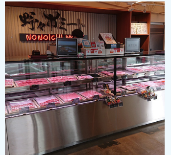
野々市ミート店内の様子