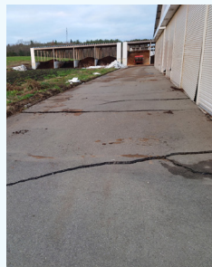
地震が起きた後の牛舎の様子。道には亀裂ができ、牛舎の一部には傾きがみられます。