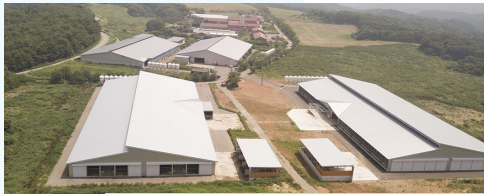
自然豊かな能登町にある能登牧場

奥能登に牧場を構えた理由は、豊かな大自然があり牛にストレスを与えることなく飼育できるためです。能登牧場では牛房を広くしたり、重機の運転時間を制限したりするなど、できるだけ牛が快適に過ごせるよう、愛情をもって育てています。