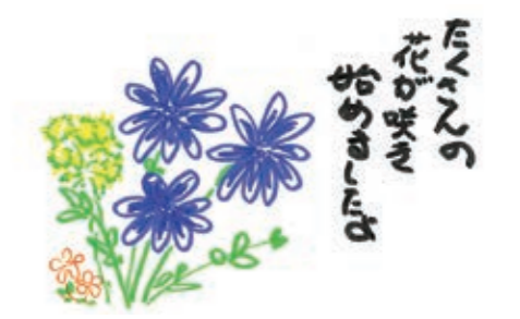
中能登町 山バアバ