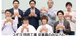
スギヨ 団地工場 従業員のみなさん

001 10月1回 1本14g 野菜色素使用 無リンすり身使用 11kcal 脂肪0.28g