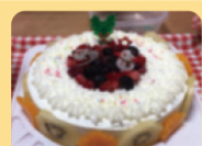
デコレーションイメージ

デコレーションケーキの台にフルーツなどを盛り付けるとオリジナルクリスマスケーキができますよ!