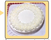
デコレーションケーキ