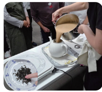
紅茶の淹れ方教室 (教え合い制度)