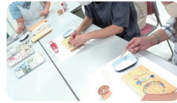
ワークショップ (教え合い制度)