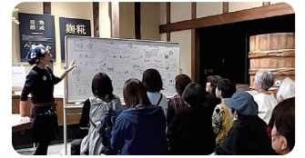
気になるメーカーさんの学習会