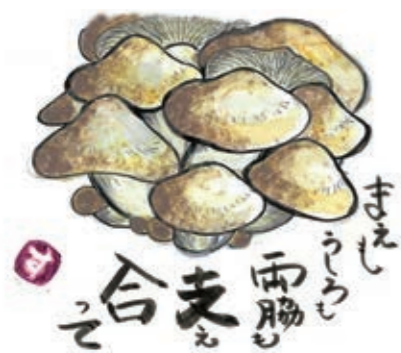
白山市 バジル・ママ