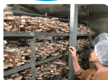
産地見学 きのこ収穫体験