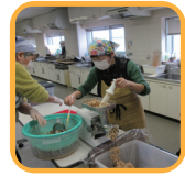
過去のみそ作りの様子