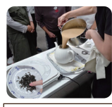
紅茶の淹れ方教室 (教え合い制度)