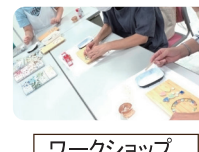
ワークショップ (教え合い制度)