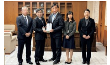
23年7月大雨災害義援金の贈呈