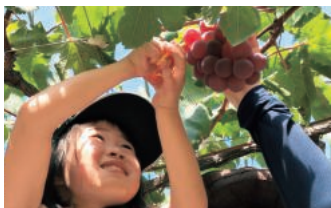
産地・工場見学「ぶどう狩り」