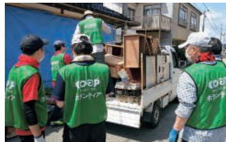
能登地域の災害ボランティアに参加