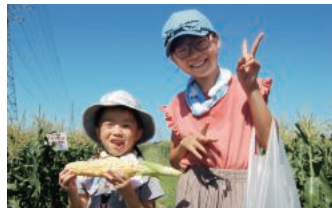
サタデー とうもろこし狩り