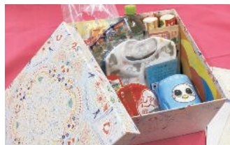
石川県内で誕生した赤ちゃんへのさまざまな企業からの贈りもの「はじめてばこ」に特別協賛