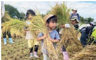
コープ農園「水田コース」 稲刈り体験

コープいしかわでは、職員が組合員をサポートし、組合員を中心とした活動を行っています。