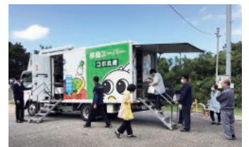
移動スーパー「コポ丸便」にて買い物支援