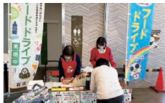
「フードドライブ」を実施