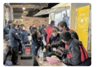
▲のとセンター職員も大喜び!

コープおおいのとり飯&とり天セットやコープやまぐちの瓦そば出来たてで喜ばれました▶