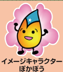
イメージキャラクター ぼかぼう