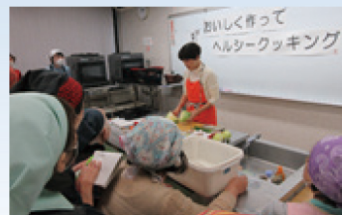
おいしく作ってヘルシークッキング