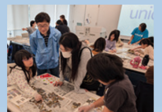
ユニセフ外国コイン仕分け体験