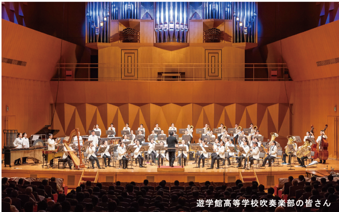
遊学館高等学校吹奏楽部の皆さん

プログラム(予定) ～平和に関するクイズ～ ～演奏曲～ ♪アニメソング ♪ジブリ名曲 ♪イマジン ♪We Are The World ～合唱「窓の外には」～