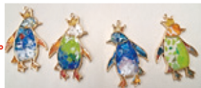
キーホルダーイメージ